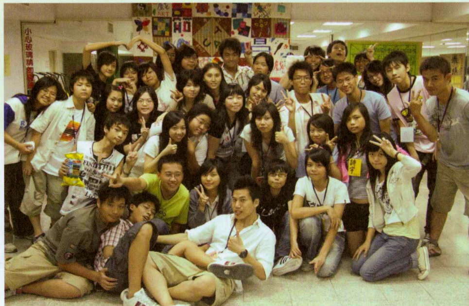
「藝術之夜」學員全體合照

小隊輔們為了最後一晚的「藝術之夜」而粉墨登場，牆上張貼著學員們前一天努力完成的拼布作品，還有這幾天來大家巧思填寫的心得留言板。各組小隊無不為了優勝獎品而卯足全力，不管是天籟合唱、即興戲劇、廣告模仿、魔術表演、扮醜耍寶，還有眾小隊輔們不計形象參與演出，都逗趣的令人捧腹大笑，經過多次激烈廝殺，前三名的隊員都獲得不錯的獎品。在研習營活動的最後一個夜晚，大夥離情依依不捨，最後在所有學員完成的大拼布之前留下歡樂的合影，更在所有人心裡留下無法忘懷的一幕。